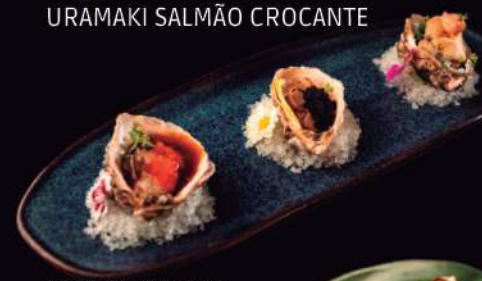
TRIO DE OSTRAS