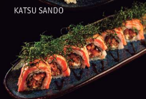
URAMAKI SALMÃO CROCANTE